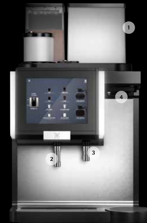
WMF 9000 F (内蔵タンク式)