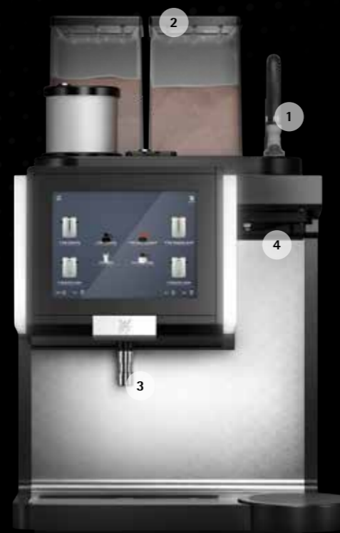
WMF 9000 F (外付けタンク式)

ターコーヒーマシンは、どちらのバージョンも、WMFならではの品質の材料、高度な技術、耐久性に優れた構造を誇り、収益性の高いサービスを長年にわたって安心してご利用いただけます。