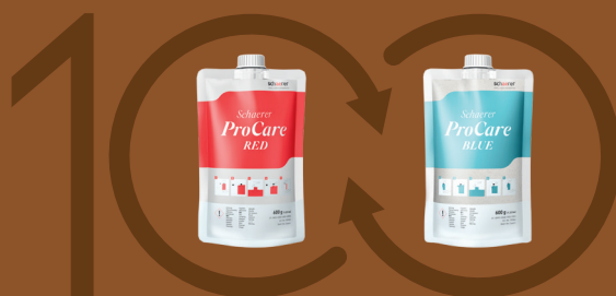
サイクルの完全自動クリーニング